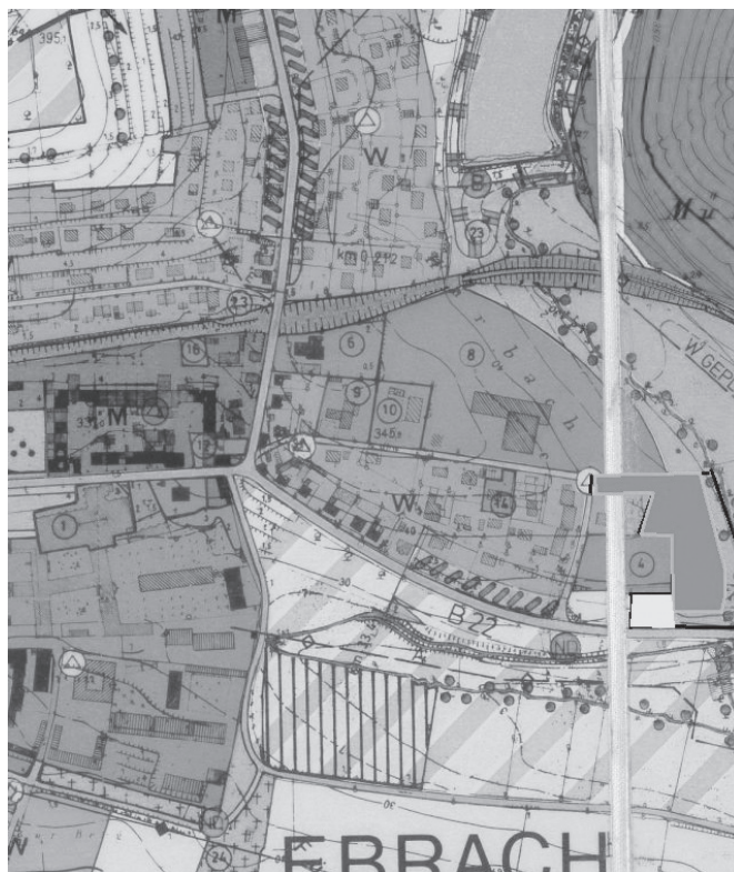
Bereich der 2. Bebauungsplan-Änderung im berichtigten Flächennutzungsplan

Die 2. Änderung des Bebauungsplans „Östlich der Neudorfer Straße und Ebrach Ost“ mit integriertem Grünordnungsplan „Wohnen am Harbach“ wurde am 11.12.2023 als Satzung beschlossen. Die Bekanntmachung des Satzungsbeschlusses erfolgte am 21.12.2023, die Bebauungsplan-Änderung ist seitdem rechtskräftig.